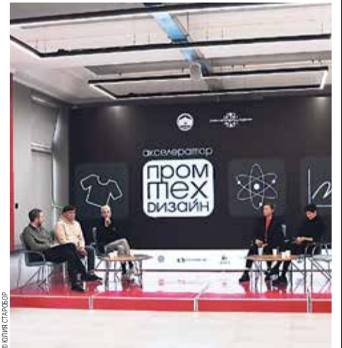
Открытие акселератора «ПромТехДизайн»

Участие студентов университета в акселерационной программе предполагает три месяца обучения, посеще-