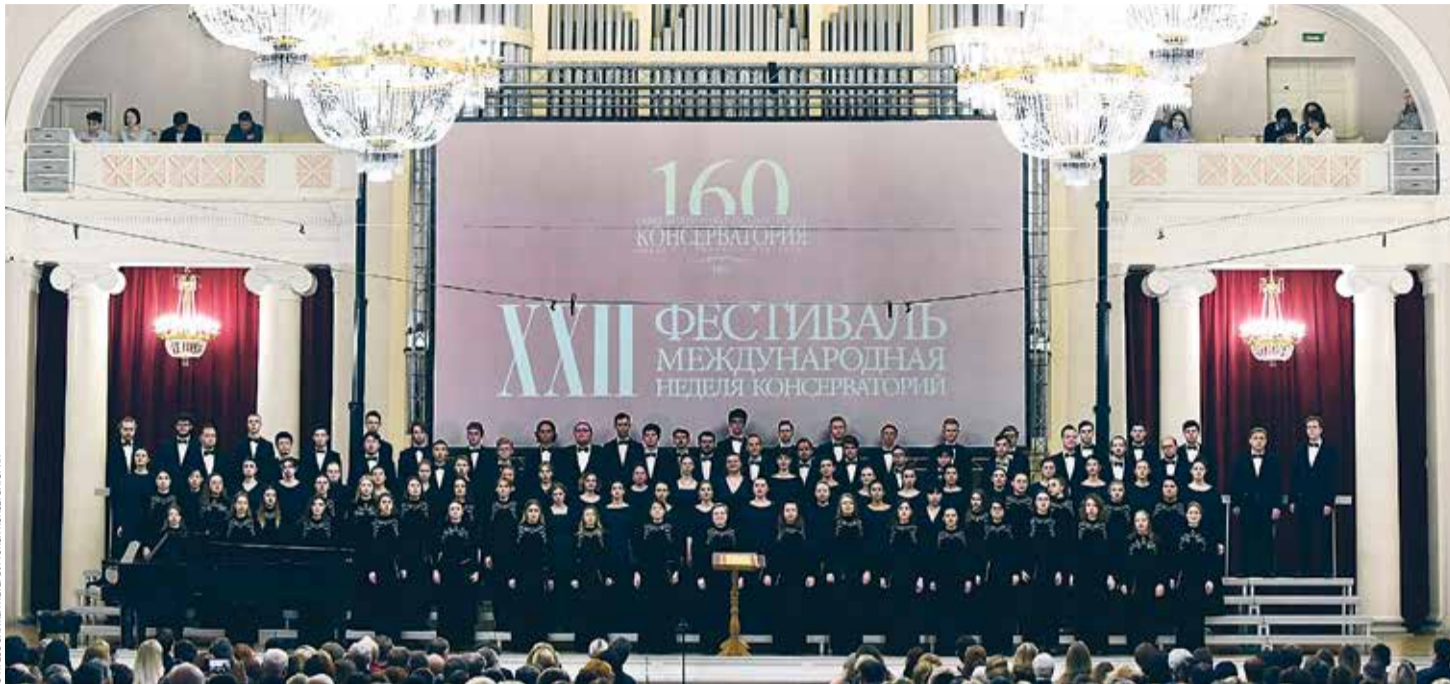
Открытие фестиваля «XXII Международная неделя консерваторий»

Отмечающая 160-летие Санкт-Петербургская государственная консерватория имени Н. А. Римского-Корсакова проводит юбилейные торжества с 22 октября по 2 ноября. В программе творческие встречи, мастер-классы, ректорский круглый стол по вопросам музыкального образования и большая концертная программа.