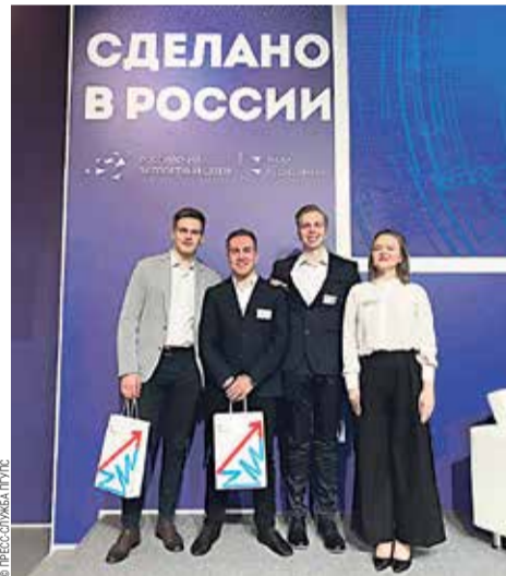
Команда факультета «Управление перевозками и логистика» ПГУПС