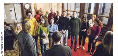
На экскурсии в Пушкинском Доме

© ПРЕСССЛУЖБА ПЕТЕРБУРГСКОЙ КОНСЕРВАТОРИИ