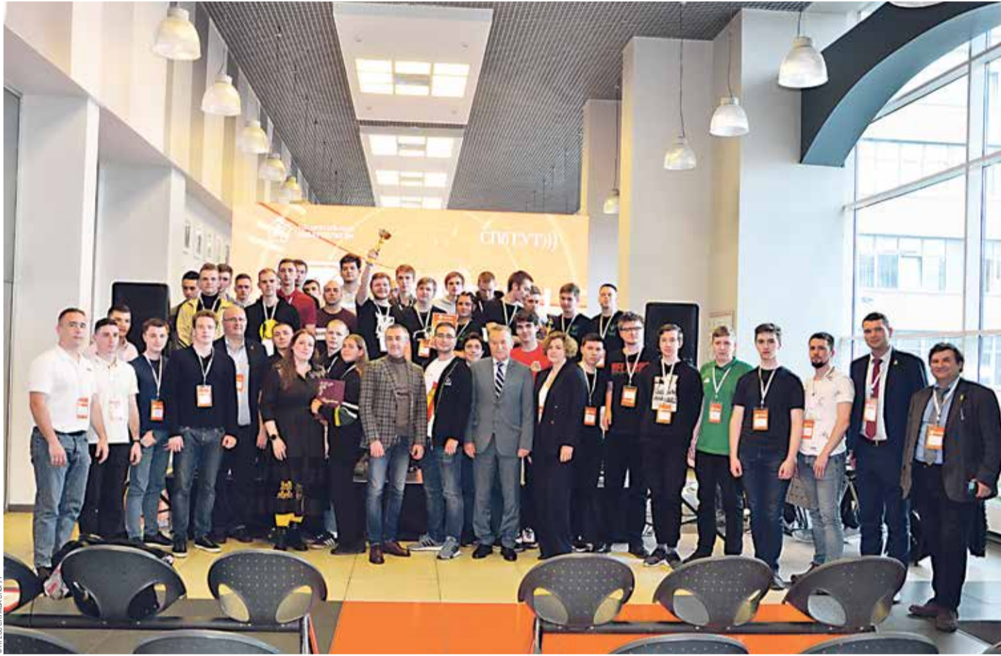
Участники и организаторы всероссийских межвузовских киберучений «OpenBonch 2022»

На базе Северо-Западного федерального образовательного центра Национального киберполигона в Санкт-Петербургского государственного университета телекоммуникаций им. проф. М. А. Бонч-Бруевича (СПбГУТ) состоялись всероссийские межвузовские киберучения «OpenBonch 2022». Участниками суперфинала стали 64 студента, представившие команды 15 российских вузов.