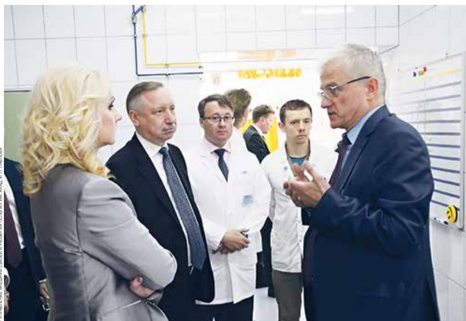
Визит заместителя председателя правительства РФ Т. А. Голиковой и губернатора Санкт-Петербурга А. Д. Беглова в ПСПБГМУ им. И. П. Павлова Минздрава России

— В какой-то степени ощущает, да. Испугались многие зарубежные специалисты, реже стали приезжать, хотя продолжают во встречах участвовать онлайн. Знаю случаи, что и в онлайн им не рекомендуют принимать участие. Но все понимают, что если мы закрываемся, мы все начинаем деградировать. Весь мировой опыт основан на том, что инновации, как звездочки, загибаются в разных частях мира. И университеты построены на том, что отслеживают все эти зажигающиеся звезды, быстро их изучают и внедряют у себя. Если мы отделимся от них непро-