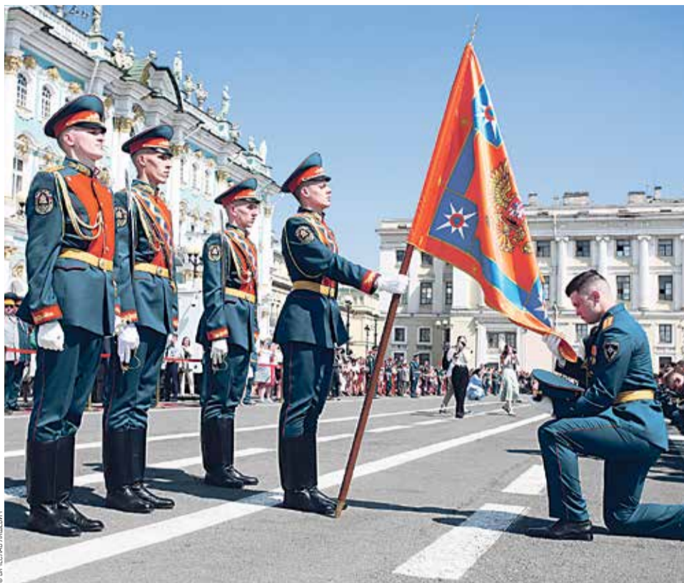
Выпуск молодых специалистов СПб УГПС МЧС России на Дворцовой площади