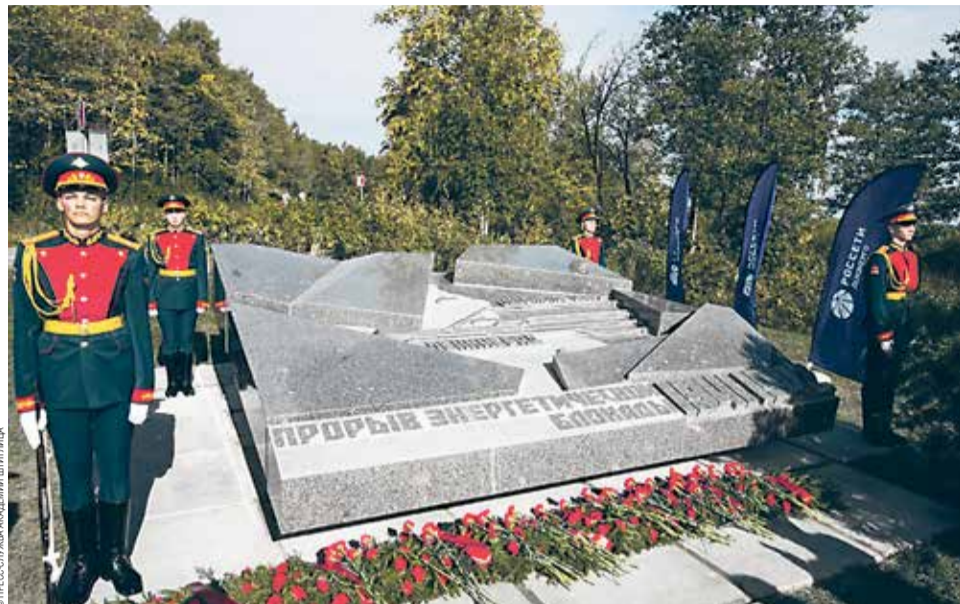
Памятник «Прорыв энергетической блокады»

«Прорыв энергетической блокады» — далеко не единственный пример создания преподавателями Академии Штиглица памятников, призванных сохранить и передать будущим поколениям память о подвиге защитников Отечества. Известный всей стране монумент «Мать Родина» на Пискаревском кладбище —