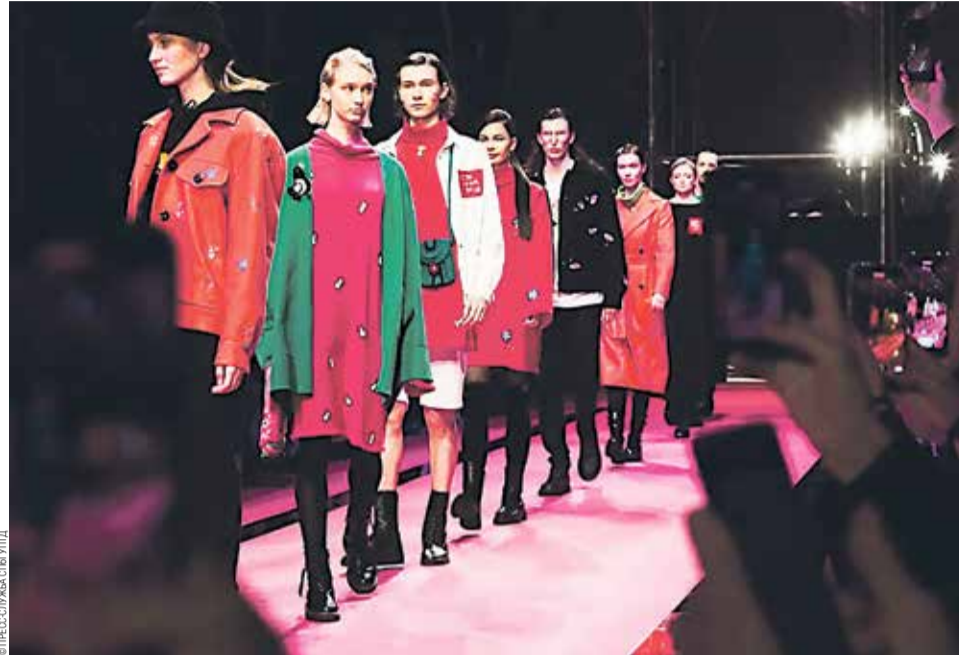
Показ коллекции молодых дизайнеров

Куратор дизайнерских программ выставки СРМ (Москва), журналист, препода-