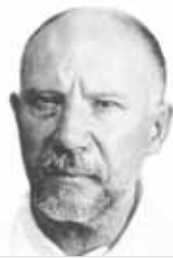
18 (1881) — Николай Сергеевич Жилиев, русский музыковед и композитор