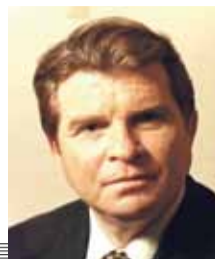
19 (1916) — Эмиль Григорьевич Гилельс, русский пианист