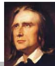
22 (1811) — Ференц Лист, венгерский композитор