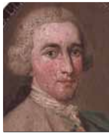
18 (1706) — Бальдассаре Галуппи, итальянский композитор

УЧРЕДИТЕЛЬ — МЕЖДУНАРОДНЫЙ ОБЩЕСТВЕННЫЙ ФОНД КУЛЬТУРЫ И ОБРАЗОВАНИЯ