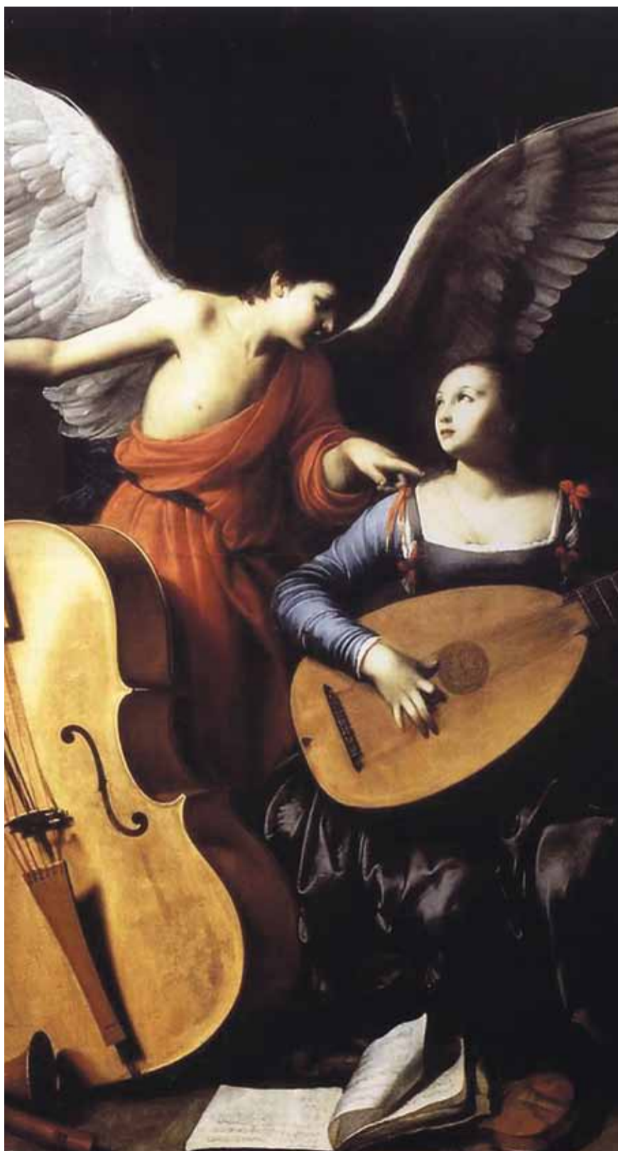
Карло Сарачени. Святая Цецилия и ангел

Международный общественный Фонд культуры и образования и газета «Санкт-Петербургский музыкальный вестник» поздравляют с юбилеем