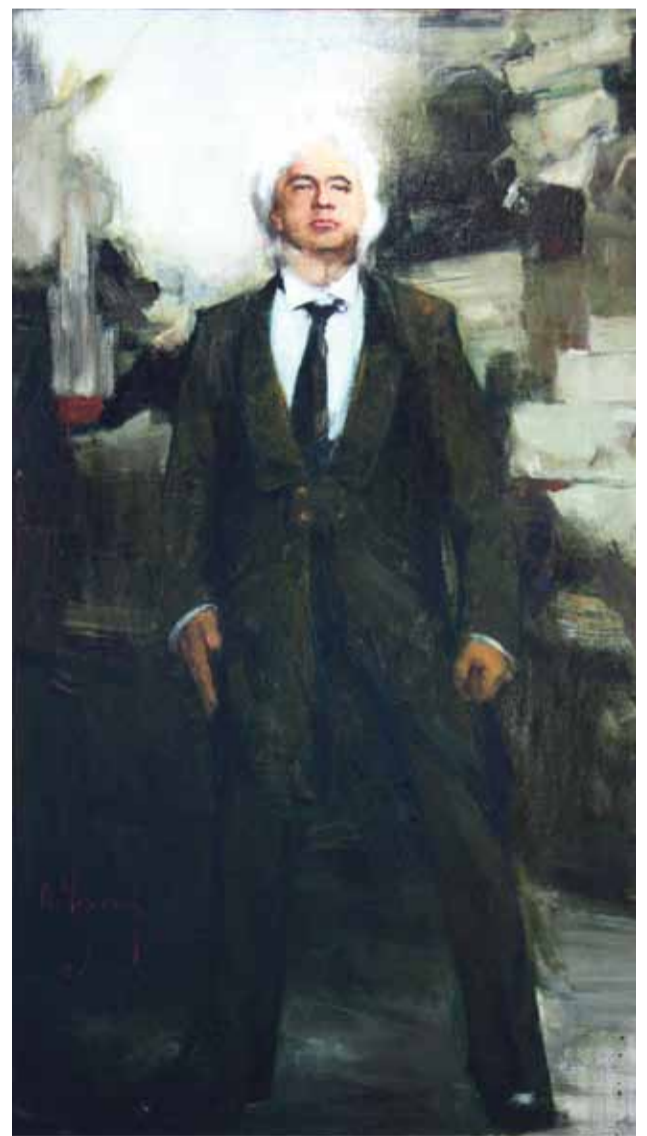
А. Черных. «Красноярский утес»