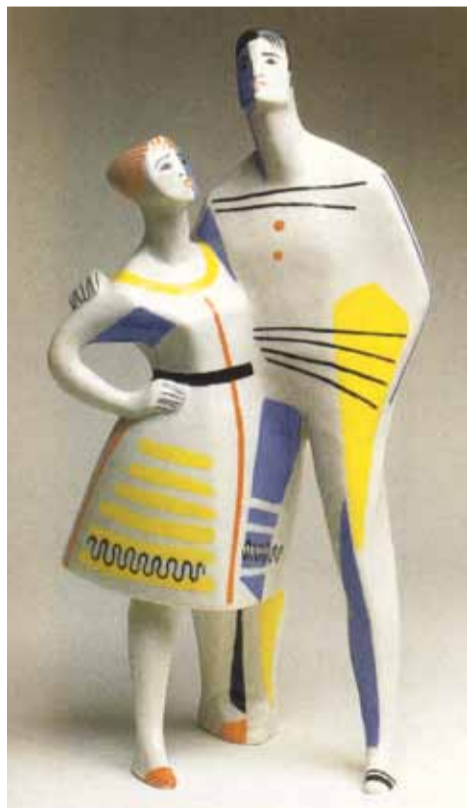
А. А. Киселёв. «Белые ночи». 1963 г. Фарфор, надглазурная роспись

Именно в ленинградской традиции оставалась — несмотря на многолетнюю борьбу с западничеством — восприимчивость к классическому модернизму в разных его проявлениях. Активно выступали на арт-сцене ученики классиков авангарда, в свою очередь обраставшие молодыми последова-