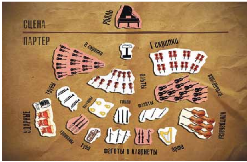
Схема раскладки оркестра на иммерсивном концерте

«Этот концерт — импровизация и для зрителей, и для оркестра, — рассказывает главный дирижер симфонического оркестра Капеллы Санкт-Петербурга Александр Чернушенко. — Совершенно новый для всех опыт живого общения, когда оркестр не картинка. К хорошим уличным музыкантам всегда хочется подойти поближе и посмотреть, как они играют. Музыканты оркестра капеллы — выдающиеся профессионалы и выдали всякое, но иммерсивный концерт мне представляется кардинально иным способом обмена информацией и энергией со слушателями. Это совсем новое и очень особенное впечатление, которое, безусловно, стоит себе подарить. И потом иммерсивный концерт — это прекрасный способ приохотить к музыке детей».