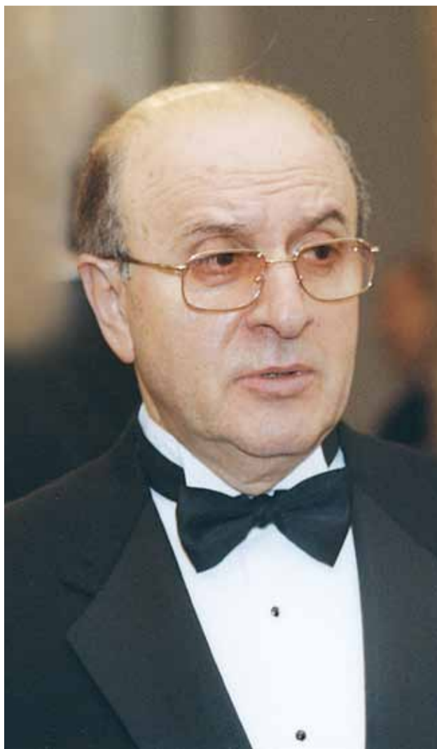
Композитор Яков Дубравин

Вечер продолжился выступлениями студенческих хоровых коллективов Петербурга: с Женским хором Музы-