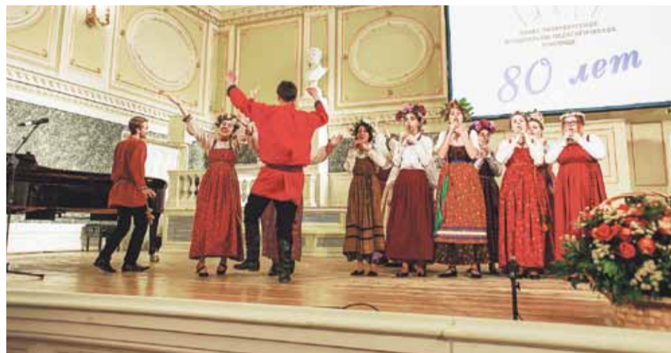
Выступает Фольклорный ансамбль МПУ

Первое, что слышишь в здании на Воскова, 1, — это хор. Здесь царит культ хорового пения. На каждом курсе — отдельный состав со своим руководителем и репертуаром. Многие успешные хормейстеры Санкт-Петербурга —