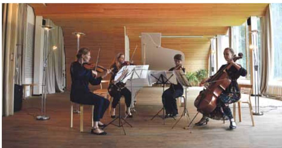
Выступление струнного квартета «Tempora Quartet»