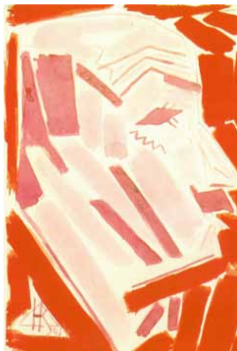
Н. Кульбин. Портрет Маринетти. 1914 г.

В Михайловском (Инженерном) замке Русского музея продолжается выставка произведений Николая Ивановича Кульбина (1868–1917) — художника, теоретика искусства, организатора художественных объединений и выставок. На экспозиции, приуроченной к 150-летию со дня рождения художника, можно увидеть более 100 произведений живописи и графики, редкие книги и архивные материалы из коллекций Русского музея, Третьяковской галереи, Санкт-Петербургского музея музыкального и театрального искусства, Музея Анны Ахматовой в Фонтанном доме, других музеев и частных собраний.