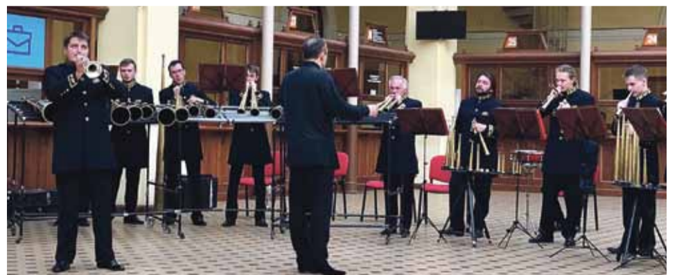
Государственный Роговой оркестр

Звучание оркестра похоже на звучание органа, но его внутренняя организация уникальна. В составе Государственного рогового оркестра 17 музыкантов — студентов и выпускников Санкт-Петербургской консерватории, лауреатов всероссийских и международных конкурсов. Роговой оркестр — яркий пример едине-