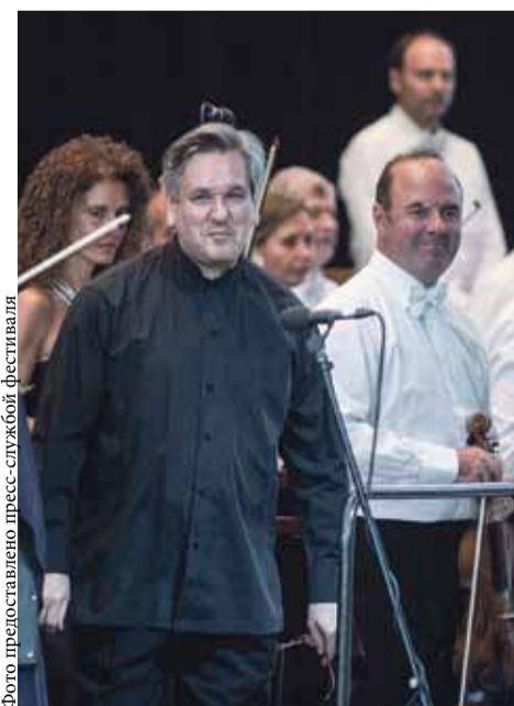
Оркестр Национальной академии Санта-Чечилия (Рим). Дирижер Антонио Паппано

Итальянские музыканты порадовали местную публику эффектными музыкальными бисами: просветленной «Italiana» из Сюиты