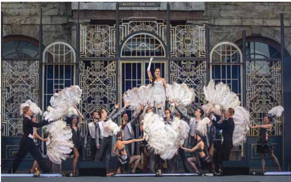
«Сильва». Фестиваль «Оперетта-парк»