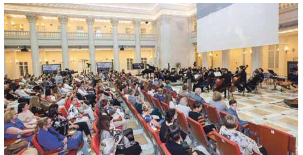
В зале Президентской библиотеки

Именно Николай I заказал и утвердил гимн «Боже, царя храни!». Это был первый настоящий русский гимн, написанный для музыкального прославления императоров русским композитором и русским поэтом. До этого все торжественные события в России сопровождалась церковными песнопениями, а при Петре Великом — военными маршами. В 1816 году был избран один из старейших европейских государственных гимнов, гимн Великобритании «God Save the King» («Боже, храни короля»). В России его стали исполнять на слова стихотворения Василия Жуковского «Молитва русских». С 1816 по 1833 год этот ставший русским