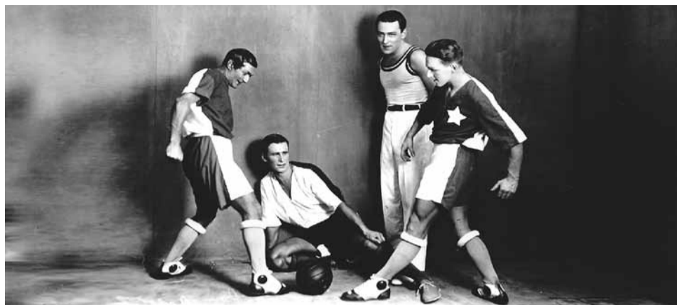
Балет «Золотой век». Номер «Футбол». ГАТОБ, 1930 год

Что ж, это разгадка спортивного увлечения композитора: он ценит в футболе изумительную красоту и точность — короткий пас,