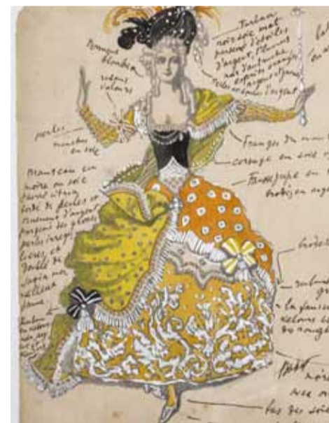
Л. Бакст. «Спящая принцесса»

Глубинные пласты истории русского балета за границы открылись благодаря приобретенному музеем архиву Сержа Лифаря с рисунками танцовщика, рукописными материалами и фотографиями, а также дару Елены и Игоря Клименковых — большому зарубежному архиву выпускницы Петербургского балетного училища Илларины Ла-