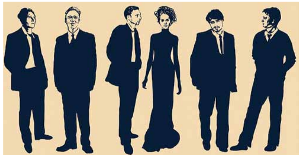
Плакат «Музыкальный салон Ю. Ф. Абазы»

И вот 25 февраля в Малом зале филармонии прошел уже четвертый концерт,