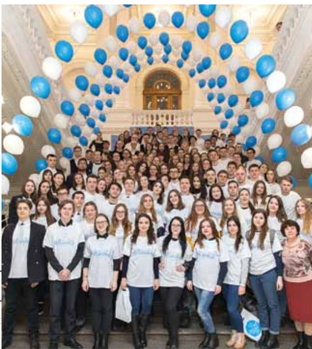
Участники открытого конкурса «Благовест — 2018»

Организатор конкурса Санкт-Петербургский политехнический университет Петра Великого уделяет особое внимание сохранению и распространению лучших традиций классического российского инженерного образования, заложенных в конце XIX века, — традиций подготовки квалифицированных инженеров, творчески мыслящих исследователей и изобретателей. Лейтмотивом «Благовеста» стали слова генерального русского инженера, великого ученого и изобретателя Владимира Григорьевича Шухова: «Техническая мысль неотделима от искусства, литературы и музыки. Не мыслю