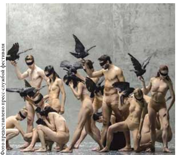
«Зимний путь». Балет Цюриха

Знаменитый песенный цикл Франца Шуберта «Зимний путь», вдохновивший Шпука на хореографическую прогулку к границам бытия, прозвучит в интерпретации Ханса Цендера. Дирижер, композитор, музыкальный исследователь XX века, Цендер фактически перенес сочинение печального лирика в наши дни и добавил ему такой мощный градус присутствия «здесь и сейчас», что отсидеться в покое и безучастности не удастся. Этот спектакль — для тех, кто легко читает абстракции и ищет встреч с героями собственных снов.