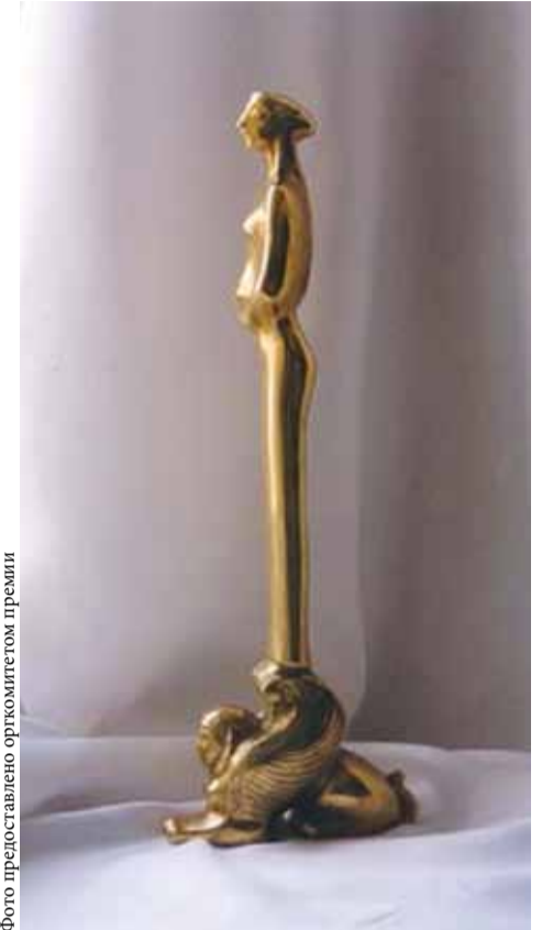
Почетная статуэтка премии Casta Diva

Торжественная церемония награждения и концерт победителей (в том числе лауреатов прошлых лет и почетных гостей) предпо-