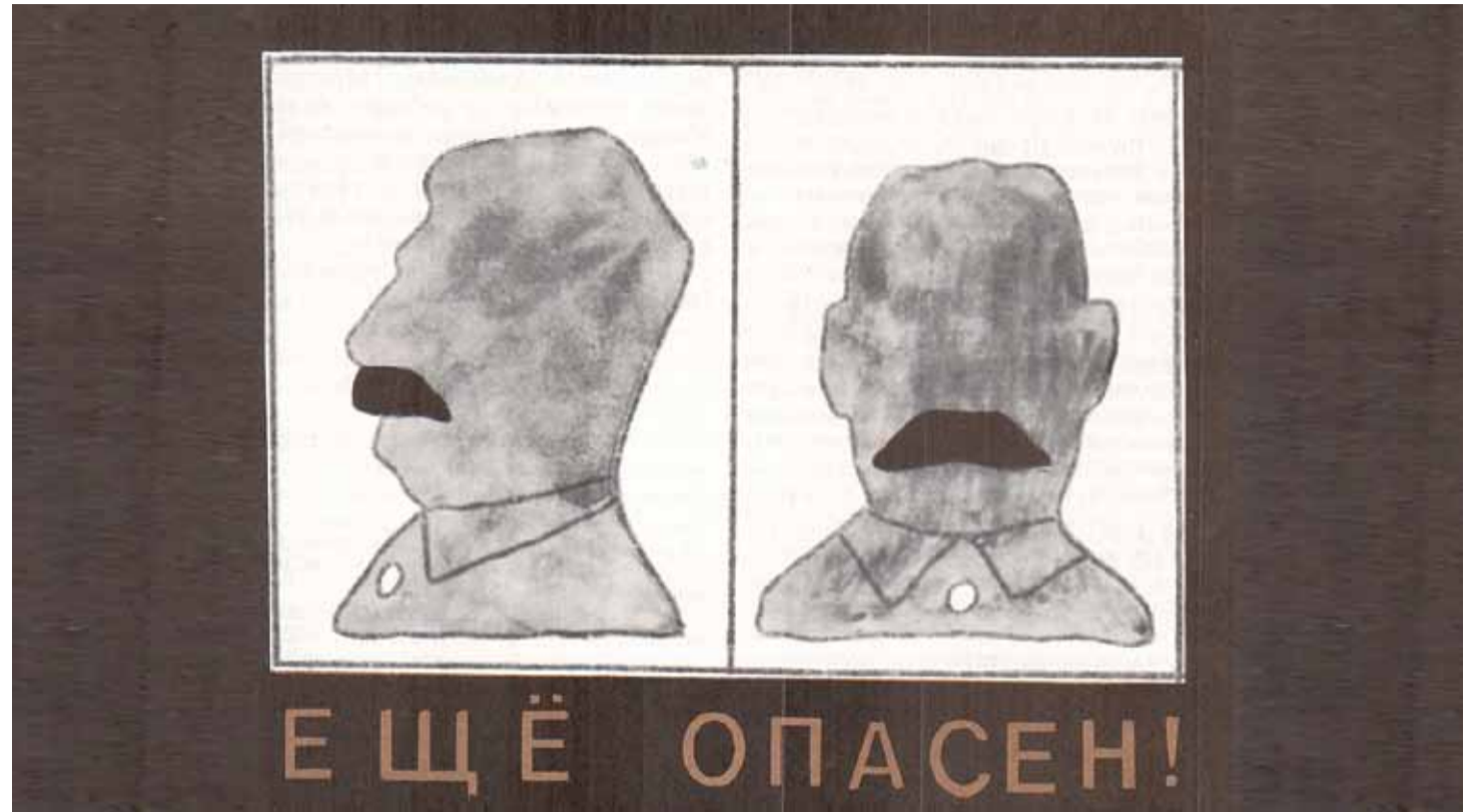
Художник Георгий Ковенчук

Открывал журнал «Опыт документальной мифологии» — это название беседы с кино-