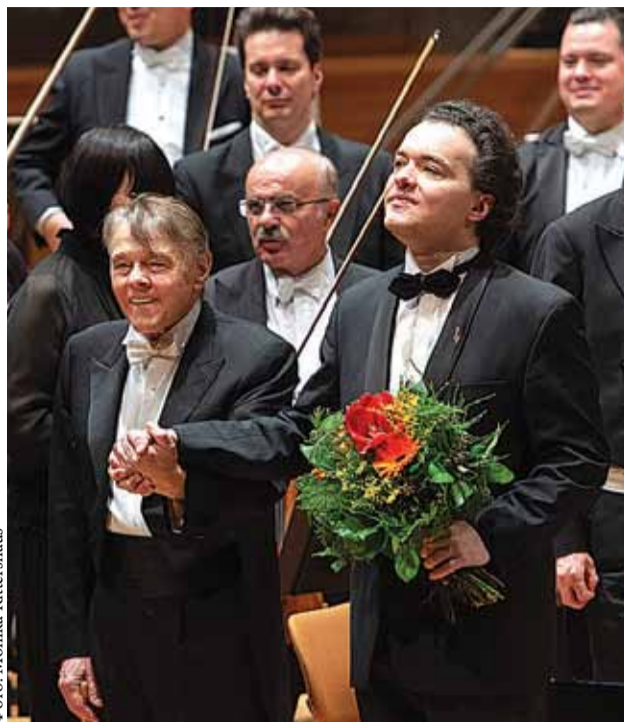
Марис Янсонс и Евгений Кисин на сцене Большого зала Берлинской филармонии

Марис Янсонс не прерывает своих дирижерских связей с Германией. Он — главный дирижер симфонического оркестра Баварского радио, с которым проводит в сезоне множе-