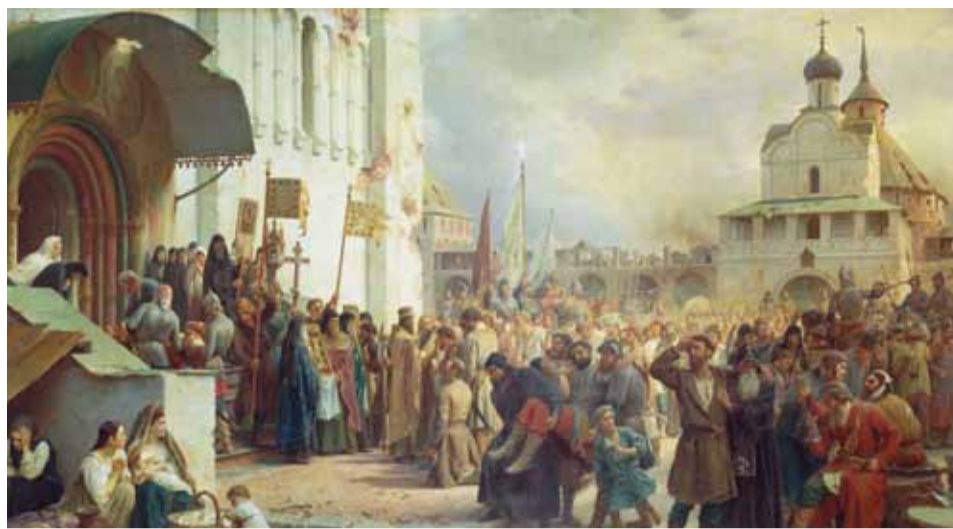
В. П. Верещагин. «Осада Троице-Сергиевой лавры». 1891 г.

Картина «Торжественное заседание Государственного совета...» вернется на прежнее место к открытию выставки Ильи Репина в Русском музее 3 октября.