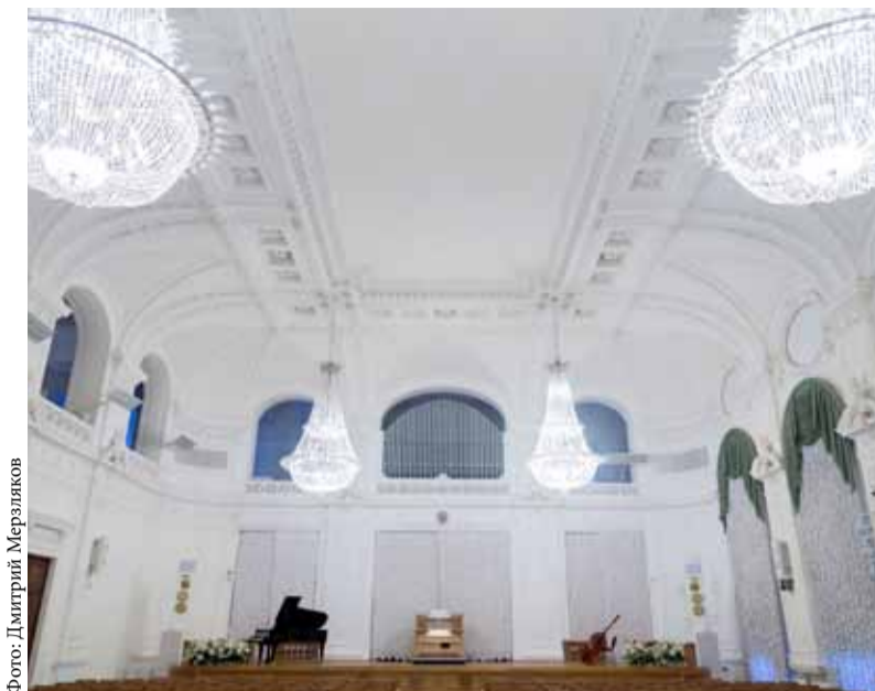
Белый зал СПбПУ

Постоянный репертуар у Белого зала сложился относительно недавно — после масштабной реконструкции зала, проведенной в 2005 году на пожертвования выпускника Политехнического университета президента Туркмении Сапармурата Ниязова. 1 сентября 2005 года состоялось торжественное открытие Белого зала как центра культурных программ Политехнического университета. На первом в новой