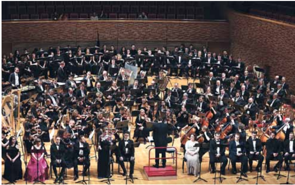
На концертном исполнении оперы «Доктор Живаго»

Опера состоит из трех действий, Пролога и Прощального слова. В Прологе звучат соловьиные трели, разноголосый птичий гомон; из причудливого переплетения звуков рождается светлая радость, наполняющая