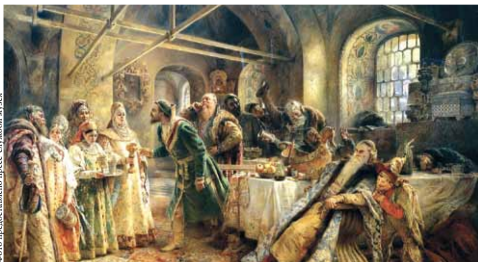
К. Е. Маковский. «Поцелуйный обряд». 1895 г.