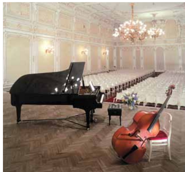
Малый зал имени Глинки

Ансамблевое музицирование было и прежде в центре программ Малого зала. «Камерная музыка, называемая также галлантной, название свое берет от палат ( camera ) и зал вельмож, в каковых палатах обычно она исполняется», — писал один из авторитетных музыкальных теоретиков XVIII века Михаэль Шписс. С открытием Малого зала это суждение было опровергнуто. Можно говорить, не боясь впасть в ученое социологизирование, о подлинной демократизации камерных музыкальных жанров. О чем свидетельствовал и расцвет квартетного исполнительства в 50–60-е годы. Жанр, требующий от слушателя глубокой сосредоточенности, приобрел множество почитателей.