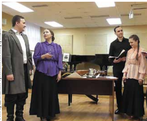
Спектакль «Провинциальные портреты» в Малом концертном зале консерватории

В последнее время особую популярность приобрел так называемый «фольклорный театр». Под этой маркой появляются многочисленные коллективы, в большинстве своем далекие от традиционного народного творчества. Теоретики пытаются дать исчерпывающее определение данному феномену, но так и не пришли к единому мнению. Практики же находятся в непрерывном поиске новых возможностей для воспроизведения образцов народного творчества с использованием законов и средств выразительности сцены.