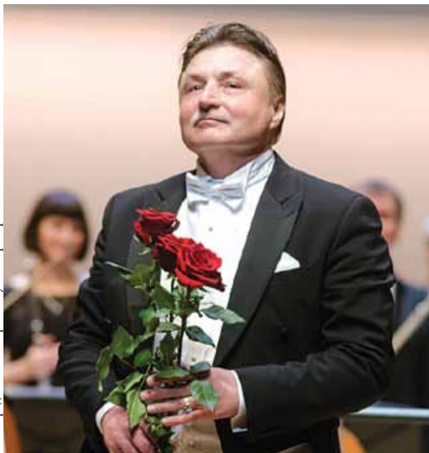
Дирижер Рашид Нигаматуллин

Монографическую программу из произведений Петра Ильича Чайковского Рашид Нигаматуллин так прокомментировал в од-