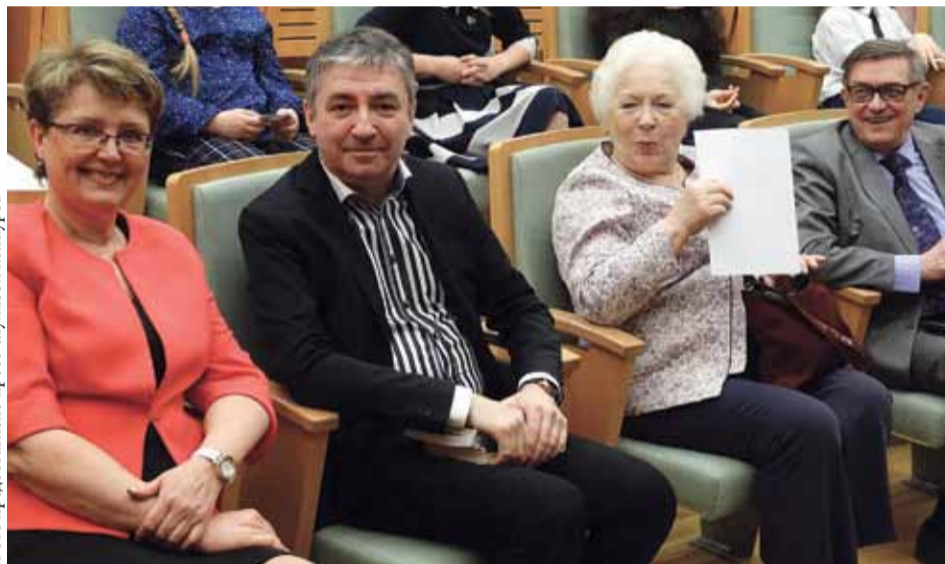
Жюри II Международного конкурса имени Н. Перельмана