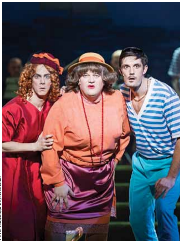
«Бал воров». Сцена из спектакля