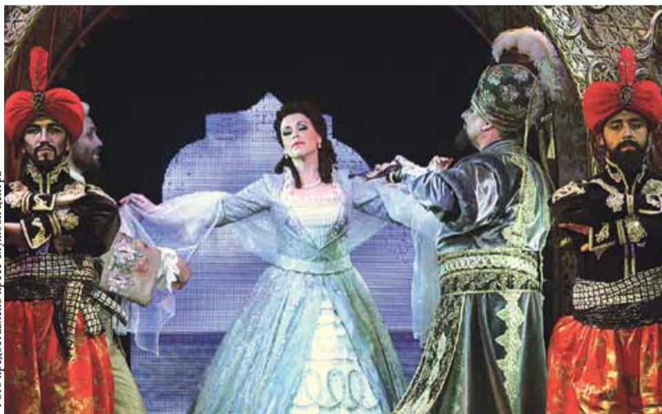
«Похищение из сераля». Сцена из спектакля

31 мая и 1 июня Государственный камерный музыкальный театр «Санкт-Петербург Опера» представит на своей сцене лирическую комедию в двух действиях «Похищение из сераля» В. А. Моцарта.