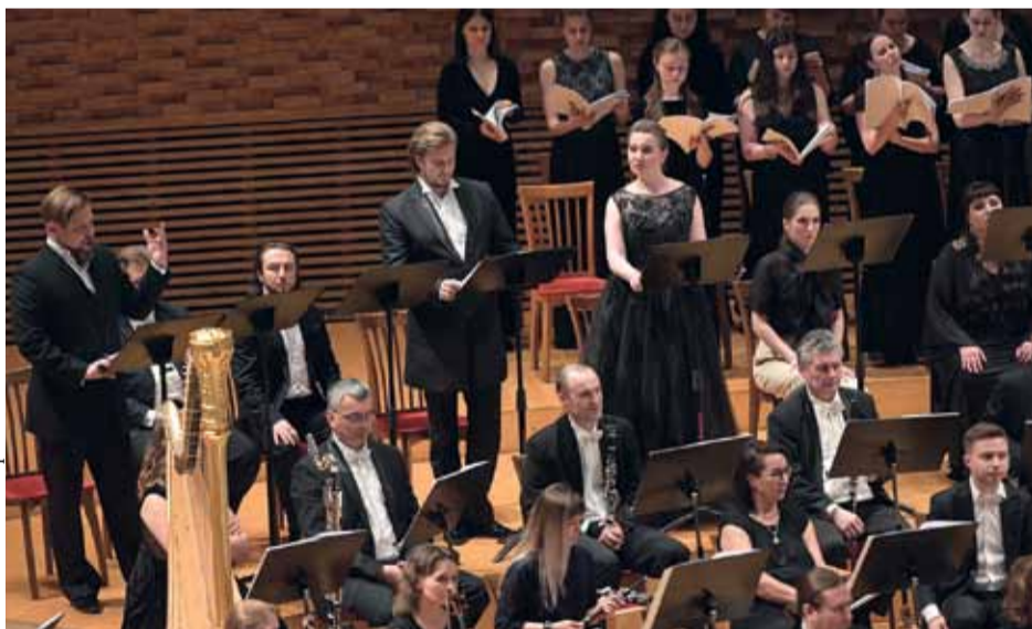
На концертном исполнении оперы «Пан воевода»

«Кашей Бессмертный», не слишком отдаляясь от сценической эстетики первой части, уводит в мир, стилизующий русский модерн и символизм. Те же четыре безмолвных служителя сцены, но уже не в черном, та же площадка с поблескивающими лужицами-озерцами. И злодей Кашей в аналогичном алом костюме, только это вроде бы латы, шпага