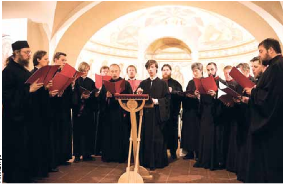
Мужской хор «Пахомий Логофет»