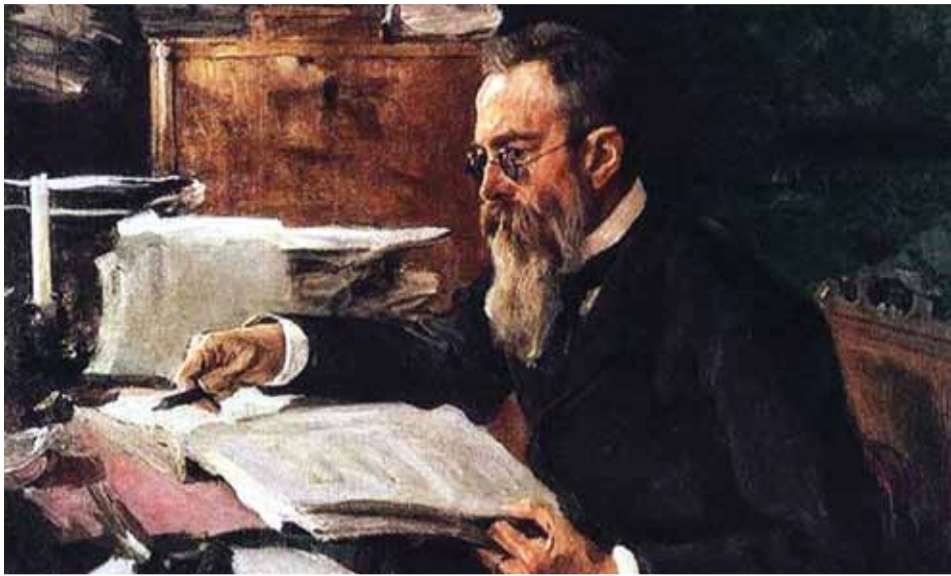
В. А. Серов. Портрет Н. А. Римского-Корсакова. 1898 г.

Остается только узнать скандинавские, индийские, итальянские имена композитора, сочинившего песни Варяжского, Индийского и Веденского гостей. А как в Испании величают автора «Испанского каприччио»? Как именуют на Ближнем Востоке автора «Шехеразады» и «Еврейской песни»? Вслед