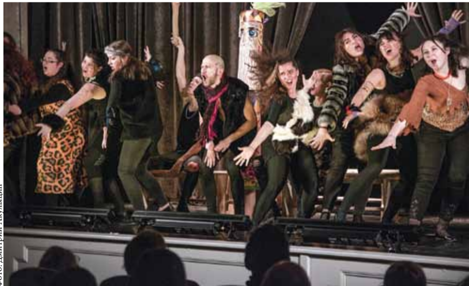
«Две стрелы». Сцена из спектакля

В разыгрываемом спектакле режиссерские задумки реализуются в живом потоке событий, и ответственность за логичность, естественность его смыслового и эмоционального напряжения лежит уже больше на исполнителях. Но спектакль не может сландиться сам по себе, как не может сам собой вырасти прекрасный сад или парк без архитектора-садовника. И не важно, что «декора-