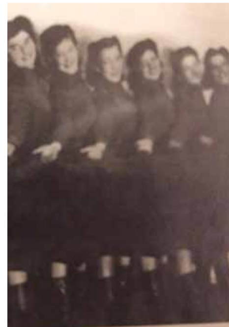
Ансамбль МПВО. 1942 год

Главный редактор — Галина Георгиевна Осипова Ведущий редактор — Иосиф Генрихович Райский Корректор — Марина Константиновна Одинокова Ведущий специалист по связям с общественностью — Ксения Павловна Иванова Дизайн и верстка — Вячеслав Валерьевич Алексеев Издатель — информгентство «Северная звезда» Адрес издателя и редакции: 197110, Санкт-Петербург, ул. Пудожская, д. 8/9, оф. 37, тел. +7 (812) 230-1782 www.nstar-spb.ru, ofko-north.star@mail.ru