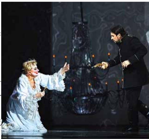
«Пиковая дама». Сцена из спектакля