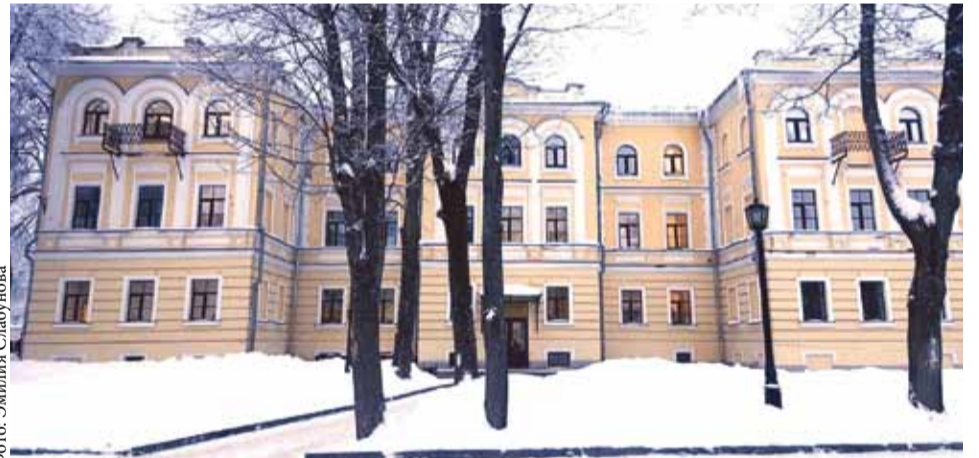
Здание Музыкального отделения колледжа в Новгородском кремле

«Переселение» в негодное для занятий помещение Института непрерывного образования Новгородского университета — с небольшими аудиториями без звукоизоляции — новгородские власти стремятся выдать за нашу инициативу в связи с якобы ухудшением состояния здания. Руководители областной администрации предложили оригинальный способ транспортировки музыкальных инструментов: из-за узких лестничных пролетов университетского здания 28 роялей будут втискивать в оконные проломы на высоте 4 этажа! Никто не может гарантировать и то, что потолочные перекрытия нового места жительства музыкантов выдержат такой многотонный груз.