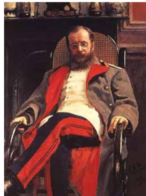
И. Е. Репин. Портрет Ц. А. Кюи. 1890 г.

Театр «Санкт-Петербург Опера» первым в России обратился к детскому музыкальному наследию великого русского композитора. В декабре 2017 года сказка о самом знаменитом Коте в постановке народного артиста Юрия Александрова возвратилась на петербургскую сцену. Спектакль получил новую оркестровку и яркое сценическое оформление с современным видеоартом. Оформил постановку известный театральный художник Вячеслав Окунев. Лаконичный и уютный даже для самых маленьких зрителей спектакль вместил в себя наравне с вокальными номерами танцевальные сцены в исполнении солистов и хора театра. Оказалось, что музыка Кюи может вдохновлять не только детей, но и взрослых. Поэтому можно с уверенностью отметить, что очередной