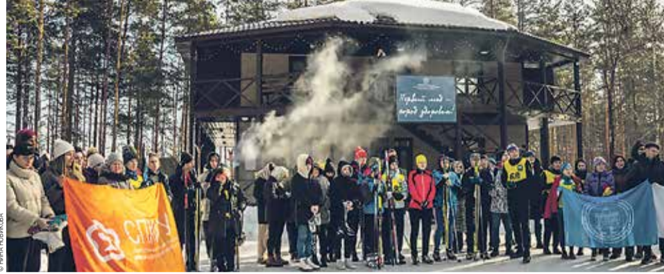
Участники Зимней спартакиады

Следующим испытанием стала конькобежная эстафета. Особо захватывающими были состязания азартных спортсменов, готовых ринуться в гонку и преодолеть все препятствия.