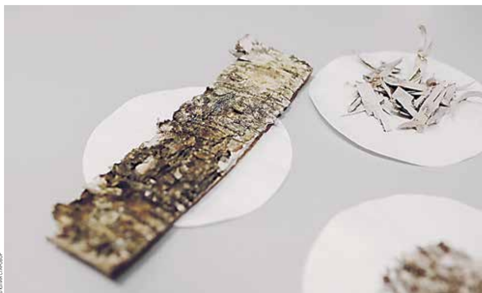
В лаборатории кафедры органической химии