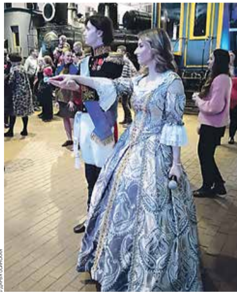
За несколько секунд до начала представления