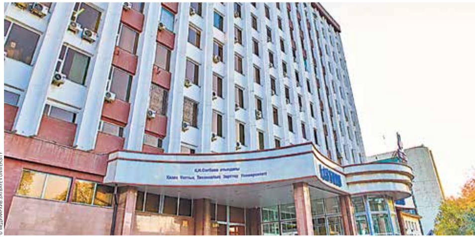
СПбПУ и Satbayev University провели переговоры о сотрудничестве

В финале переговоров стороны договорились о подписании комплексного договора о сотрудничестве и детальном проработке дорожной карты. На ближайшее время представители СПбПУ и Satbayev University запланировали ряд тематических встреч на уровне институтов по направлениям взаимного научного интереса. В переговорах в формате видеоконференции от имени Политехнического университета примут участие представители Института компьютерных наук и технологий, Институ-