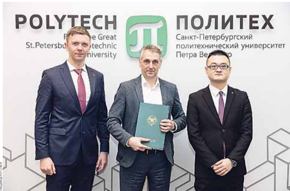
Подписание договора о создании подготовительного центра «Политех-Таншань»

Подготовительный центр «Политех-Таншань» будет функционировать на базе Тан-