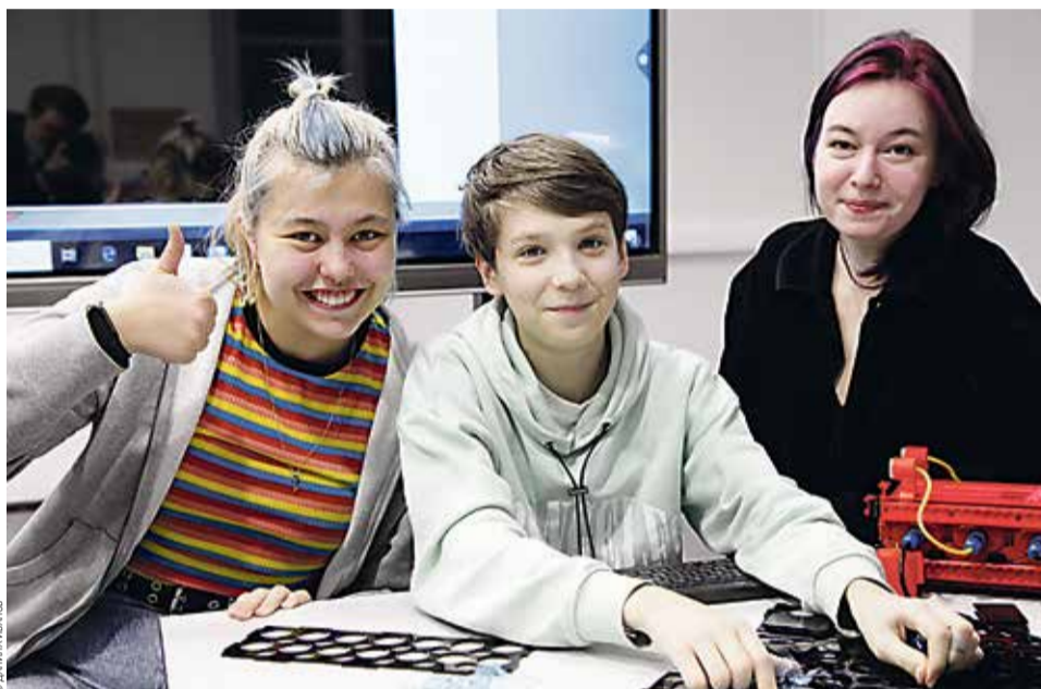
Участники зимней проектной школы «Транспорт и логистика» в технопарке универсальных педагогических компетенций РГПУ им. А. И. Герцена

— В ВУЗЕ ДАН СТАРТ РАБОТЕ ТЕХНОПАРКА УНИВЕРСАЛЬНЫХ ПЕДАГОГИЧЕСКИХ КОМПЕТЕНЦИЙ. В ЧЕМ ЕГО ОСНОВНАЯ ЗАДАЧА И КАКОВА ЦЕЛЕВАЯ АУДИТОРИЯ?