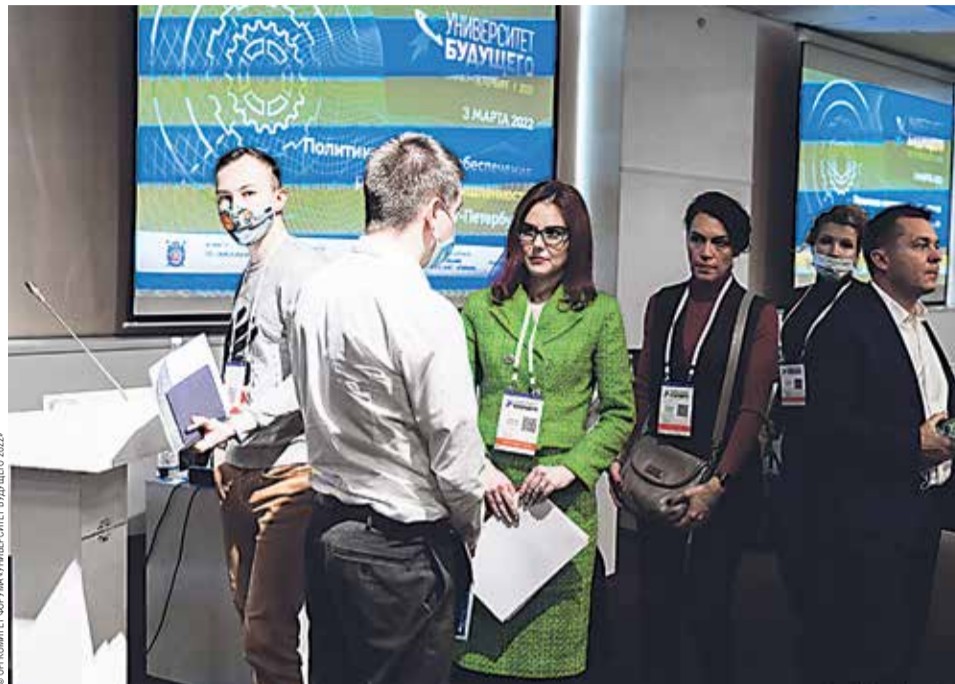
На дискуссионных площадках форума

переподготовку уже взрослых специалистов, а также поиск формата работы с таким кадровым потенциалом, как фрилансеры и самозанятые.