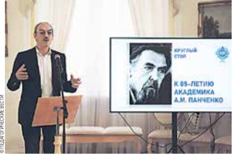
Народный артист России Михаил Боярский

85-летию со дня рождения Александра Михайловича Панченко, выдающегося русского филолога, академика РАН, исследователя русской литературы и культуры на переломе от Средневековья к Новому времени, посвятили круглый стол в Российском государственном университете им. А. И. Герцена (РГПУ им. А. И. Герцена).