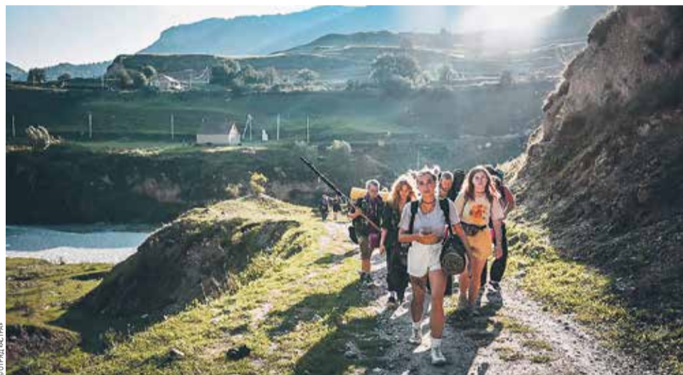
Путешествие на Кавказ

— Как правило, мы едем далеко от Петербурга. За впечатлениями, деньгами