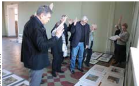
Жюри выбирает победителей конкурса

В рамках программы юбилейных мероприятий, посвященных 350-летию Петра I, в Главном корпусе Санкт-Петербургской государственной художественно-промышленной академии имени А. Л. Штиглица открылась межвузовская выставка-конкурс студенческих графических работ «Город Петра».