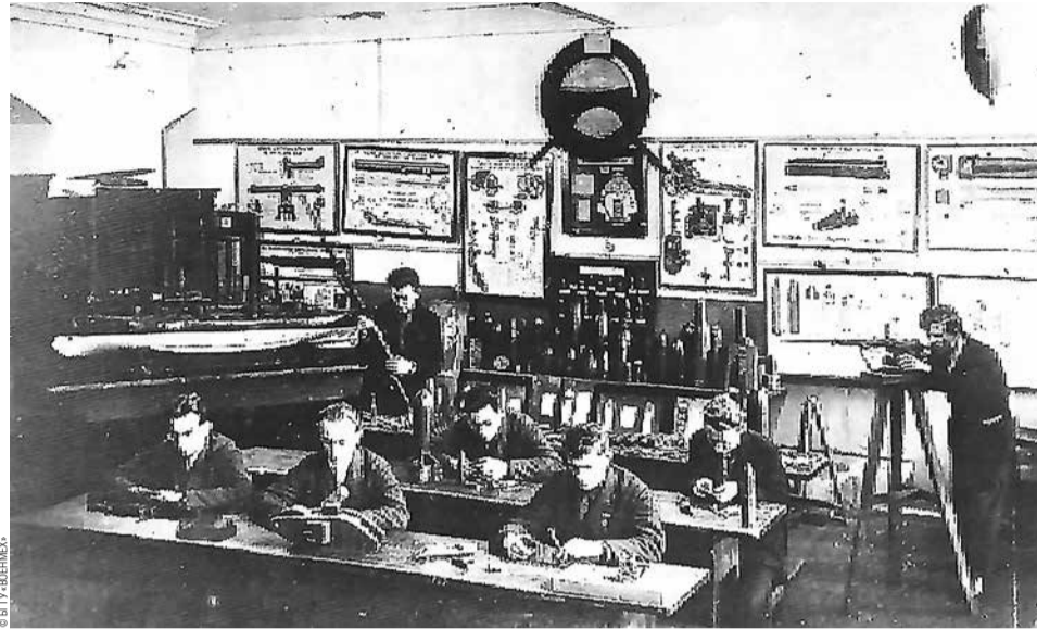
Слушатели Ленинградского механического института на занятиях. 1931 г.

Такая целевая установка нового техникума потребовала, с одной стороны, постановки на должный уровень именно производственного обучения, с другой — тщательного планирования теоретической подготовки. Обе эти задачи в 1918–1921 гг. были сложными: главным образом из-за голода, холода, нехватки одежды, материалов, инструментов, электроэнергии и т. д. Кроме того, станки в мастерских за время их работы для военных нужд в 1915–1917 гг. оказались сильно изношенными и требовали ремонта. Важно,