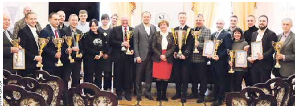
Вручение наград вузам в Олимпийском зале КФКиС Санкт-Петербурга

— 3-я группа (от 3–5 тысяч студентов) — НГУ им. П. Ф. Лесгафта, Санкт-Петербург (1-е место), СПбГМТУ (2-е место) и Ленинград-