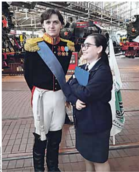
Александр I и студентка XXI века