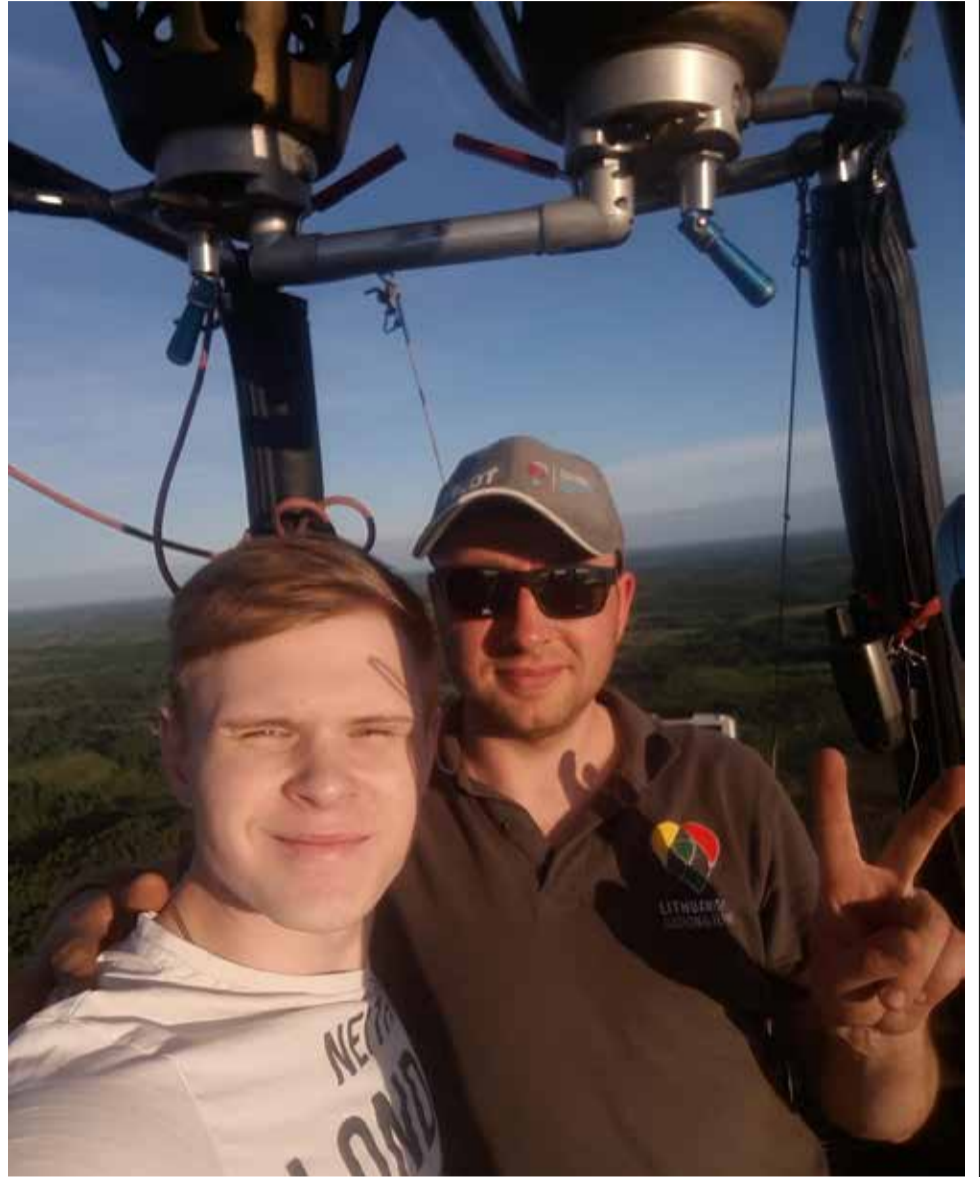
На высоте птичьего полёта

С 10 по 16 июня в городе Великие Луки прошла 23-я Международная встреча воздухоплателей.