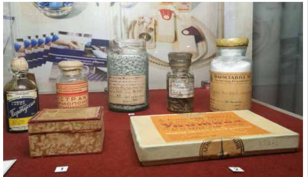
На выставке «Медицинская столица»

Военно-медицинский музей принимал участие в прошедшей в нашем городе Ночи музеев и подготовил действительно уникальную программу. Посетители музея смогли