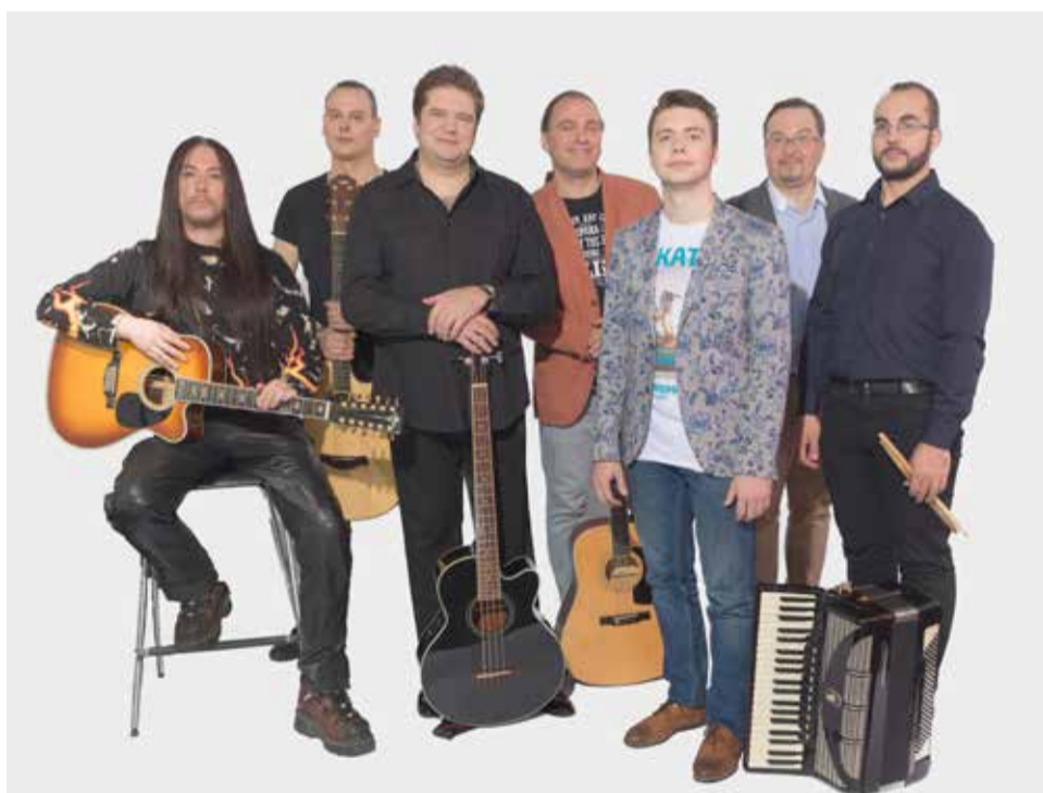
Творческое объединение «Меломаны»