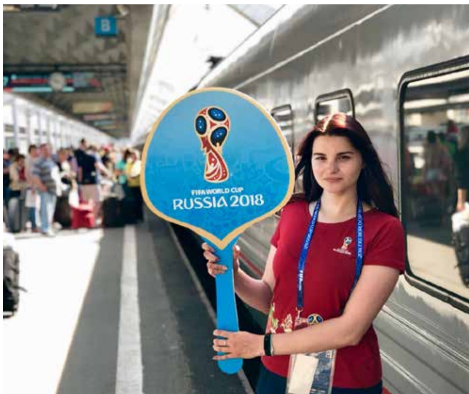
Встреча болельщиков на Московском вокзале