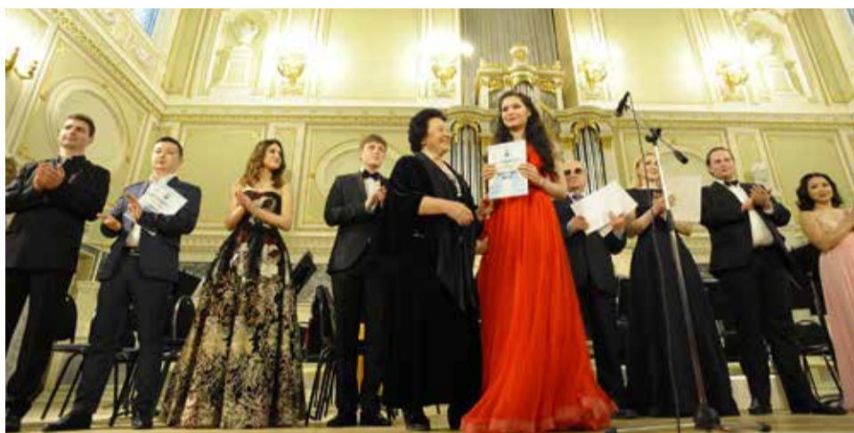
Государственная академическая капелла Санкт-Петербурга. Заключительный гала-концерт и награждение победителей 46 Всероссийского смотра-конкурса вокалистов-выпускников музыкальных вузов. Победителей награждает Ирина Богачева, народная артистка СССР, заведующая кафедрой сольного пения Санкт-Петербургской консерватории, профессор