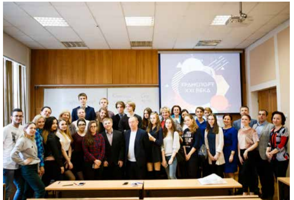
Школьники — участники семинара «Транспорт XXI века»

В Петербургском государственном университете путей сообщения Императора Александра I (ПГУПС) большое внимание уделяют профориентационной работе. Выбор будущей профессии — задача не из простых, и здесь помогают старшеклассникам ответственно подойти к этому вопросу.