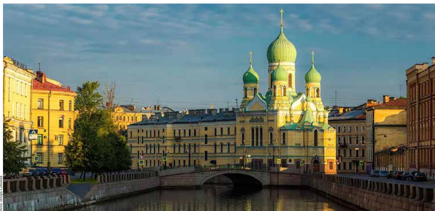
Церковь священикомученика Исидора Юрьевского