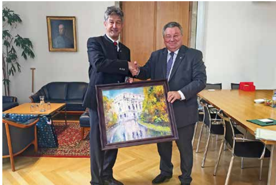
В этом году СПбПУ и ТУ Грац отметили пятилетие стратегического партнерства

Подводя итоги круглого стола, ректор ТУ Грац Харальд Кайнц отметил значительные результаты пятилетнего партнерства. «Наши университеты очень похожи. Мы видим, что за многие годы сложились действительно прочные связи между научными группами, и сегодня мы видим их результаты. Особенно важно, что к научной деятельности активно подключаются студенты. Представленные сегодня студенческие проекты отражают высокий уровень проводимых работ», — отметил он.