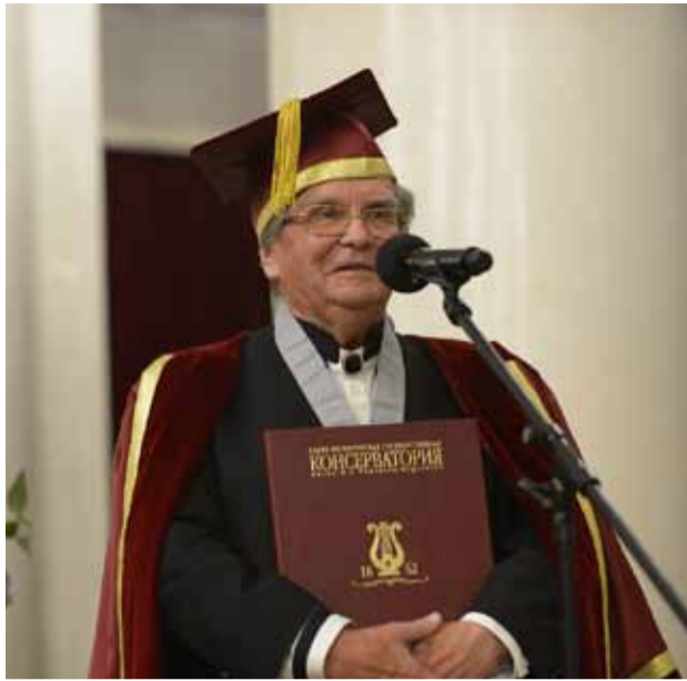
На церемонии вручения Владимиру Федосееву мантии почетного профессора Санкт-Петербургской консерватории