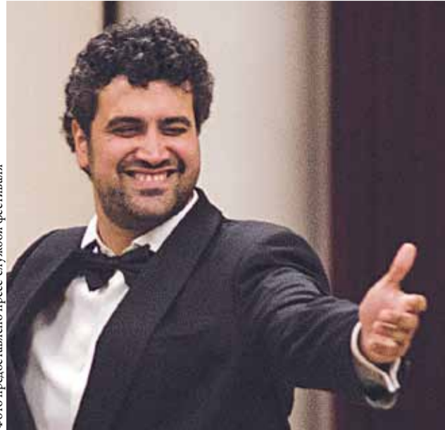
Дарио ди Виетри

В канун этого Нового года одни из самых ярких теноров из двух солнечных стран — Дарио ди Виетри и Перч Каразян — устроят настоящий музыкальный батл! Но в