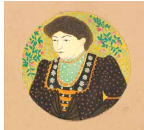
К. С. Малевич. Женский портрет (погрудный). Середина — вторая половина 1900-х гг.