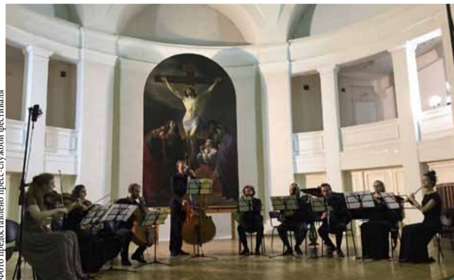
Русско-немецкий проект Gartow Connect-II

Затем вниманию слушателей была представлена аранжировка известного произведения Рихарда Штрауса «Веселые проделки Тили Уленшпигеля», мастерски выполненная Францем Хазенёрлем (1885–1970). В настоящее время в России (и в мире) эта версия известна крайне узкому кругу профессионалов, да и личность самого аранжировщика остается загадочной. Свою аранжировку симфонической поэмы Штрауса Франц Хазенёрль создал в 1954 году и обозначил произведение как музыкальный гротеск для 5 инструментов.