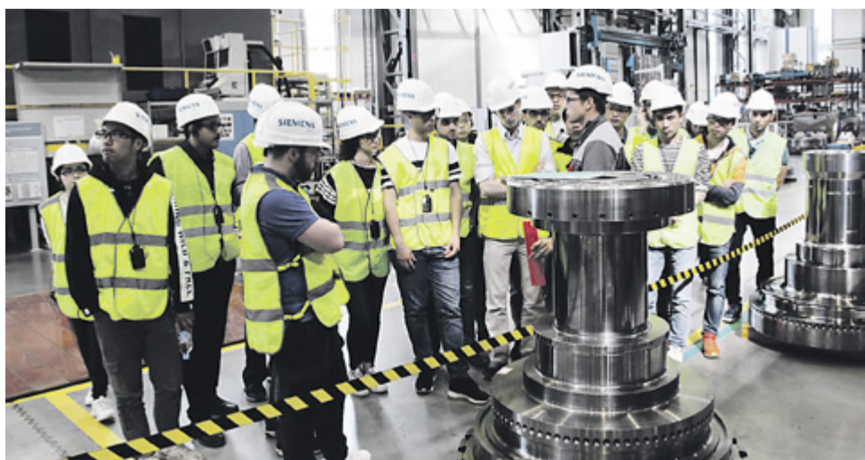
Студенты-энергетики посетили отделение компании Siemens

Многие сетуют на то, что солнечных дней этим летом было совсем мало. Однако в насыщенной жизни студентов Международной летней школы Политеха времени на разговоры о погоде практически не было: множество новых друзей, обширные культурная и образовательная программы и неповторимый колорит Северной столицы сделали их пребывание в нашем городе наполненным яркими впечатлениями, несмотря на капризы погоды.