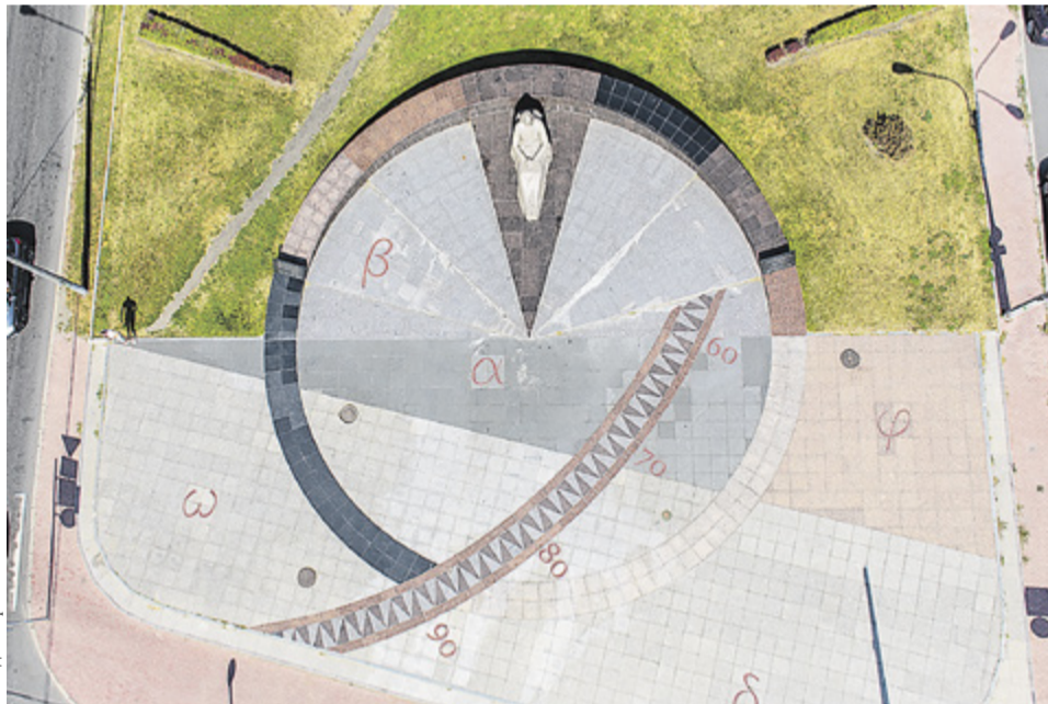
Памятник К. Э. Циолковскому в Санкт-Петербурге, на пересечении набережной Обводного канала и улицы Циолковского. Скульптор Л. Бейбутия, архитекторы О. Глазова и И. Заболотский

научных трудах и изобретениях? Надо прямо сказать, что даже сейчас, когда наш великий современник достиг своего семидесятипятоголетия и имя его почти у всех на устах, лишь немногие имеют правильное представление о том, что собственно сделано Циолковским для науки и техники за 40 лет его неустанной деятельности». Увы, сегодня, когда мы отмечаем 160-летний юбилей «калужского мечтателя», эти слова совсем не потеряли актуальность.