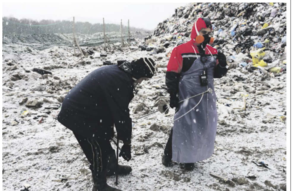
Аспиранты кафедры гражданского строительства и прикладной экологии СПбПУ на полигоне ТБО