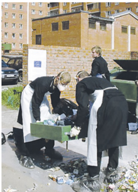
Исследование морфологии ТБО