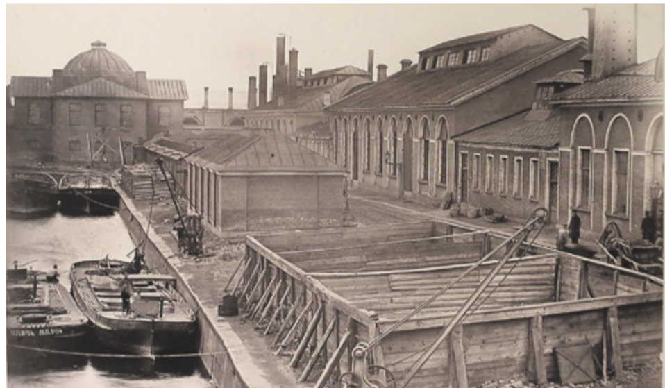
Вид зданий на территории Адмиралтейских Ижорских заводов (слева направо): стальная мастерская, целопробная мастерская, якорный завод, меднопрокатный завод, меднолитейная мастерская, малый прокатный цех

сетить Музей истории завода. Л. Д. Бурим отметила, что это один из старейших ведомственных музеев города. Первая экспозиция была открыта 60 лет назад, в ее создании приняли участие сами сотрудники предприятия и жители города Колпино. Общими усилиями было собрано 15 тысяч единиц хранения. Сегодня музей представляет собой памятник промышленной архитектуры и принимает участие в таких проектах, как «Открытый город» и Форум малых музеев.