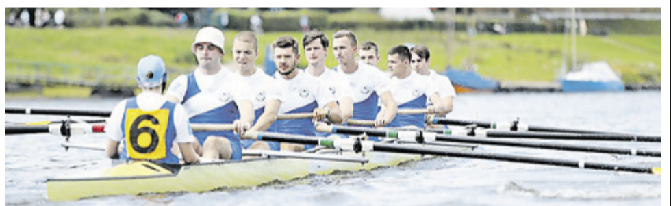
Сборная ПСПбГМУ им. акад. И. П. Павлова во время соревнований

С 17 по 22 августа на реке Эльбе (Дрезден, Германия) проходили соревнования по гребному спорту Dresden Rowing Cup.