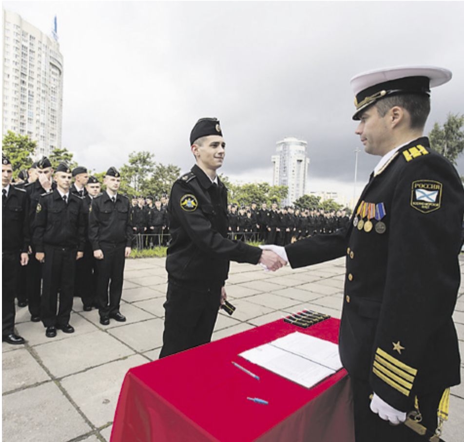
Вручение погон выпускникам УВЦ СПбГМТУ