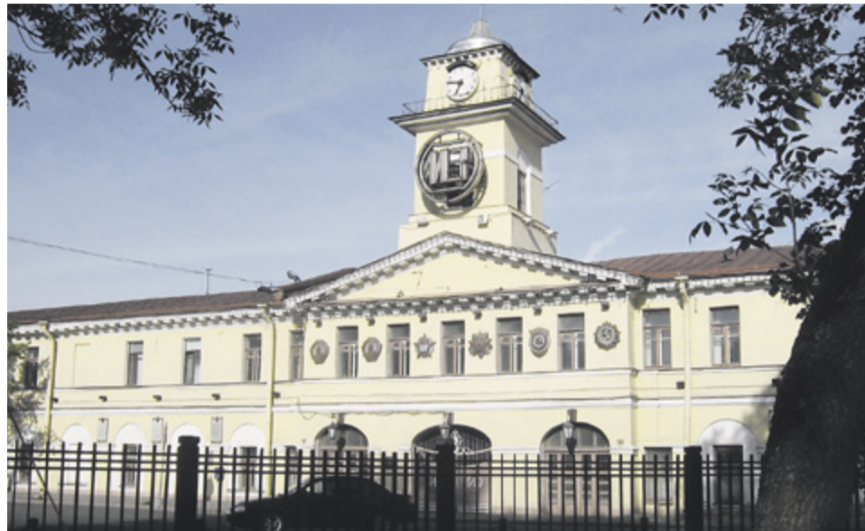
Адмиралтейские Ижорские заводы

Погрузиться в историю крупнейшего предприятия тяжелого машиностроения не только Колпинского района, но и всего Северо-Западного региона можно, если по-