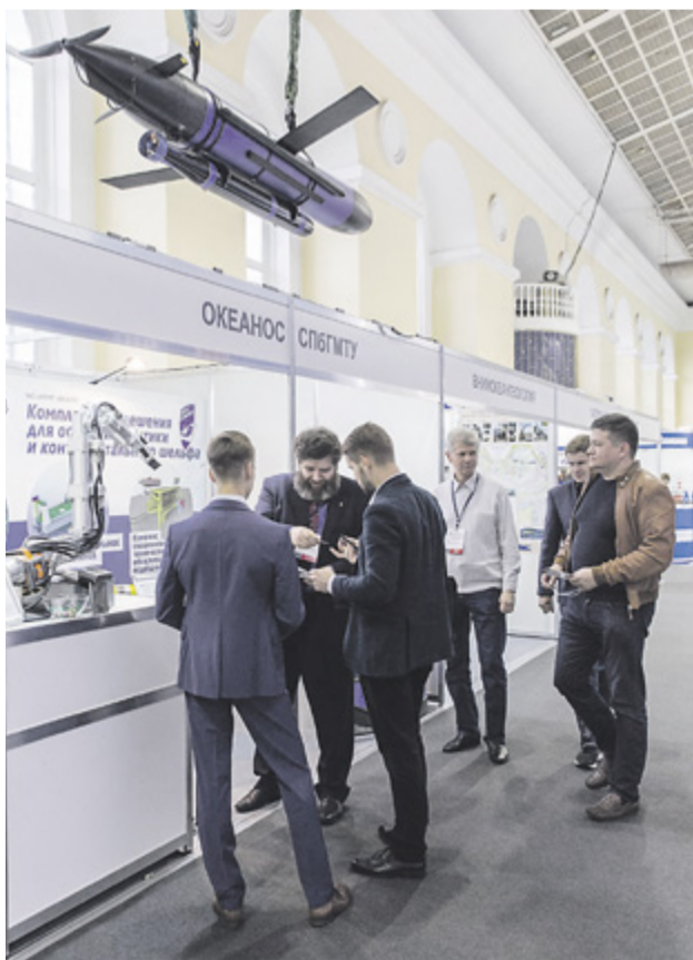
Стенд СПБГМТУ на выставке RAO CIS Offshore 2017

Одной из известных проблем освоения шельфа является отсутствие необходимой береговой инфраструктуры, сложность и большие затраты на ее строительство на севере. Для решения этой проблемы ученые Корабелки предложили концепцию автоматизированных подводных терминалов, которые позволяют загружать нефтепродукты на танкеры без создания дорогостоящей береговой ин-