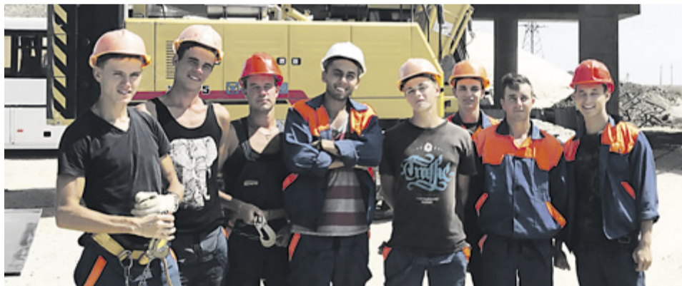
Бойцы студенческого производственного отряда «Две столицы» на строительстве Крымского моста

Сергей рассказал, что работы на строительстве Крымского моста ведутся вахтовым методом. В каждой смене работает примерно по четыреста человек. Двадцать представителей ПГУПС влились в бригаду мостостроителей. Опытные прорабы и мастера