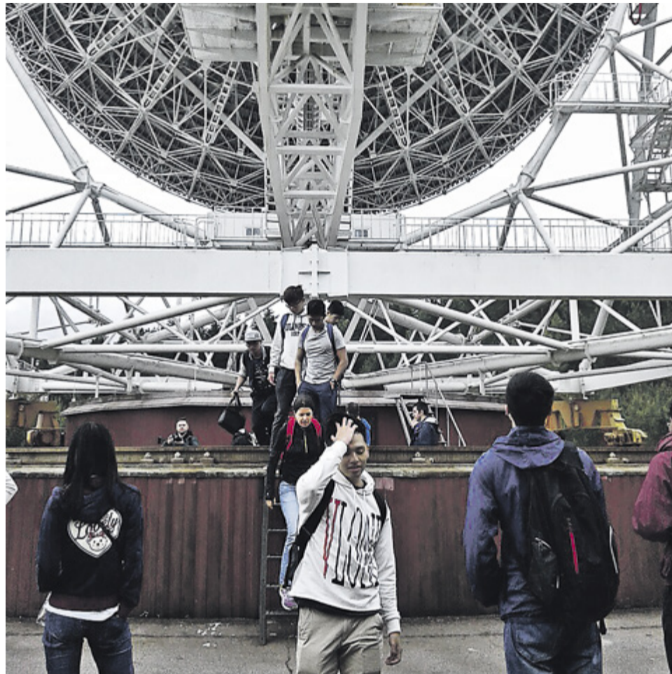
Студенты модуля «Космические технологии» на экскурсии в радиокосмической обсерватории «Светлое»

Отличительной особенностью модулей «Реконфигурируемые микроэлектронные устройства» и «Гражданское строительство и дизайн» стала возможность получения сразу двух сертификатов: СПбПУ, а также компаний Altera Corporation (для учащихся модуля «Реконфигурируемые микроэлектронные устройства») и Autodesk (для учащихся направления «Гражданское строительство и дизайн»). Лицензированные этими компаниями специалисты читали лекции студентам летней школы Политеха: доцент кафедры «Компьютерные системы и программные технологии» Института компьютерных наук и технологий (ИКНиТ