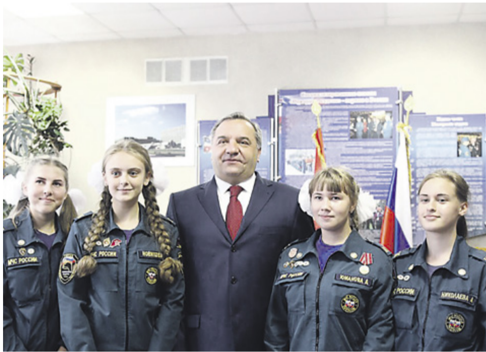
Глава МЧС России В. А. Пучков в «Школе пожарных кадетов»